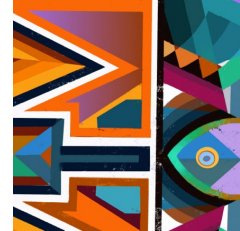
베어링 블랙 얼라이언스 & 블랙 탈런트 네트워크