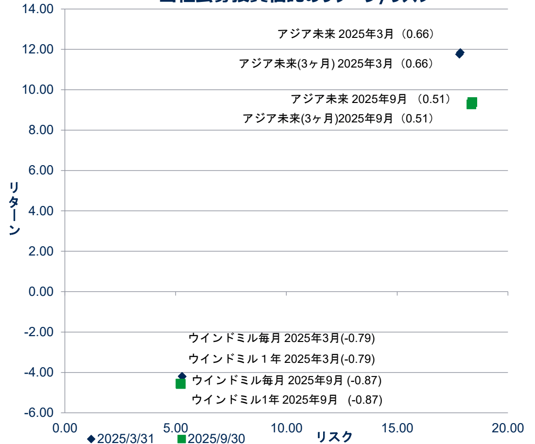
当社公募投資信託のリターン/リスク

リターン（年換算）は2025年9月30日を基準日として過去5年間の月次の基準価格の騰落率を用いて算出。リスク（年換算）は上記の月次の基準価格の騰落率の標準偏差。騰落率算出の際に用いる基準価格は分配金再投資後（税引前）の基準価格を使用。