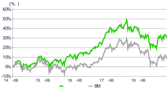
2014.06.30 Class F