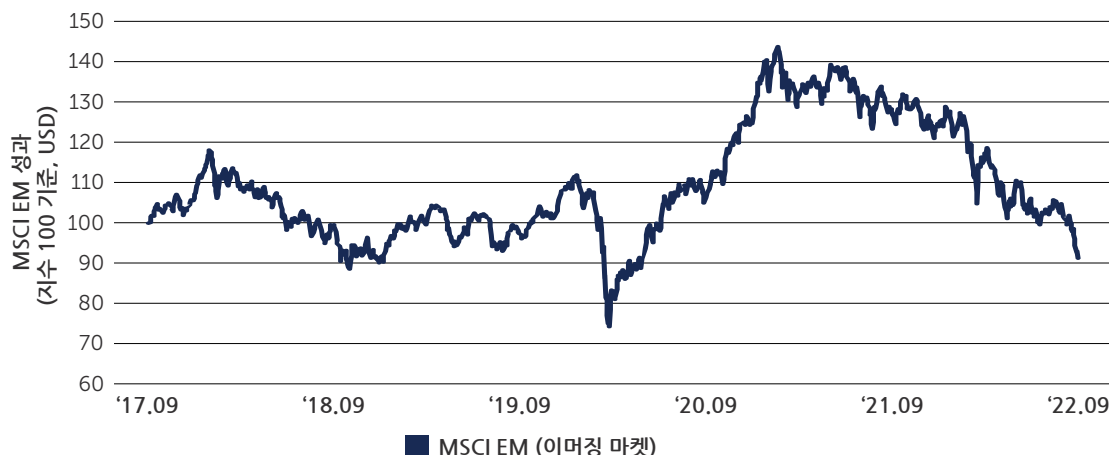
도표 1: 약세 지속하는 이머징마켓 주식

2022년 9월 30일 기준.