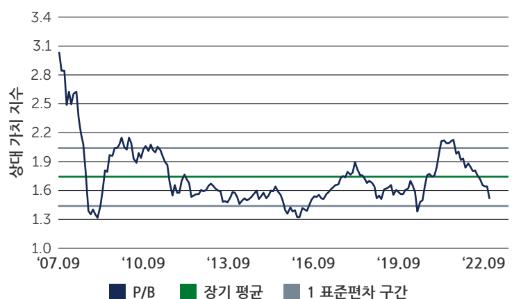
도표 4: 과거 위기 최저치 수준에 근접한 주가순자산비율(PBR)

출처: Barings; MSCI; Factset. 2022년 9월 30일 기준.