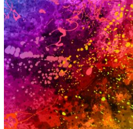
Out & Allies