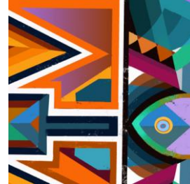
베어링 블랙 네트워크